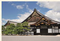
二条城二の丸御殿

京都市観光協会直営の二条城売店では、入城記念符などここでしか買えない二条城オリジナル商品や京都みやげを多数取り揃えています。また、隣接するカフェでは、スイーツやドリンクを販売。ショッピングや休憩にご利用ください。