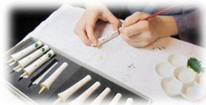
オリジナルの和ろうそくを作ってみよう！

各期ごとに、ご利用いただける学校を決定し、ご利用可否、時間等をご連絡いたします。 なお、予定の範囲を超えるお申し込みがあった場合等は抽選とします。