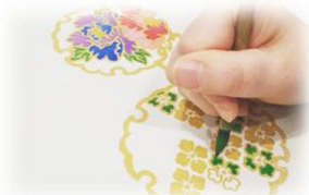
ランチバックorトートバック（※素材は現地で選択）を手描友禅の技法で染めてみよう！